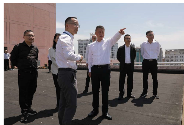
5月15日,台州市委常委、温岭市委书记朱建军一行走访浙江省肿瘤医院台州院区(台州市肿瘤医院),调研人才队伍建设等。图为朱建军正在对二期工程及发展规划作指示。(图/文 郑昕)