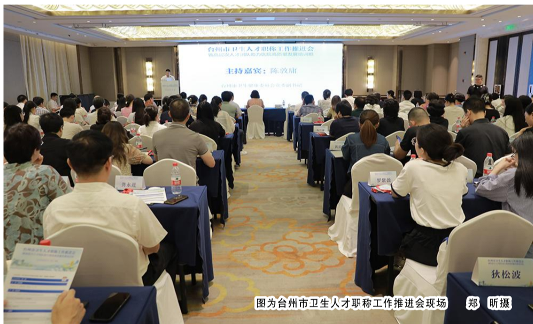
图为台州市卫生人才职称工作推进会现场

称评审、人才培养、医院高质量发展等方面的新政策、新理念、新思路,为推进全市卫生健康事业高质