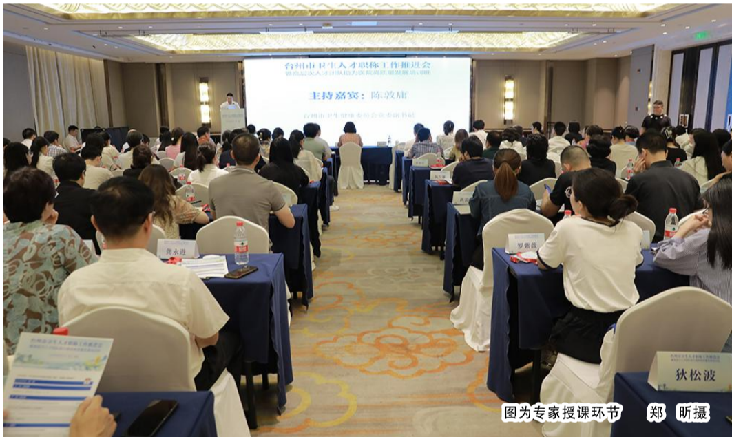
图为专家授课环节

此次继教班的成功举办, 不仅是对叙事医学理念的一次有力推广, 更是对提升区域医疗服务质量、促进医疗事业健康发展的一次重要贡献。我们相信, 在叙事医学的引领下, 医疗服务能够迈向更加人性化、高效化的新时代。