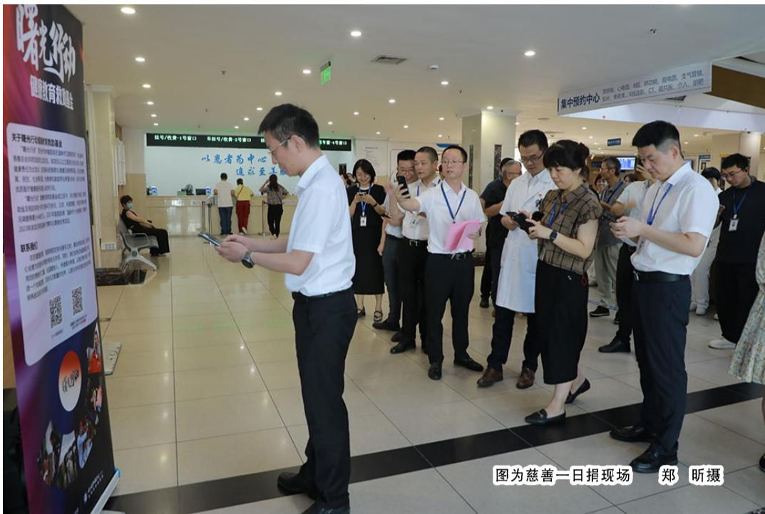
图为慈善一日捐现场

本报讯(记者 程妮娜)在第九个“中华慈善日”与第十个“99公益日”来临之际,9月5日,浙江省肿瘤医院台州院区(台州市肿瘤医院)举办一场别开生面的“慈善一日捐”活动,以实际行动响应国家号召,汇聚爱心力量,为温岭市“天使一日捐”公益项目添砖加瓦,共同为提升医疗救助水平、改善群众健康福祉贡献力量。