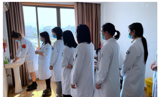
3月8日,台州市肿瘤医院健康管理中心举行别样的“手卫生”活动,相互提醒,相互监督,规范洗手操作,体现团队合作,以前所未有的方式庆祝新冠疫情下的女神节。