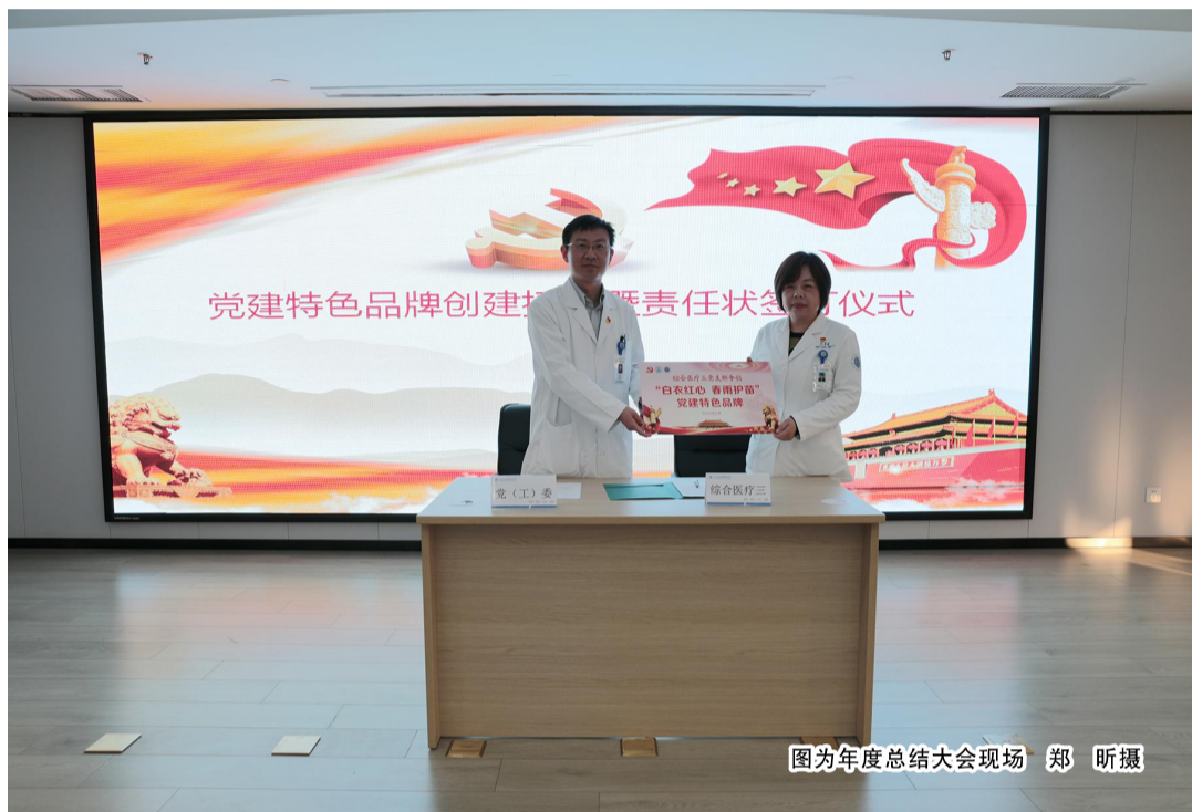
图为年度总结大会现场

本报讯(通讯员 姜舒)2月25日,台州市肿瘤医院医共体召开党员大会,总结2021年