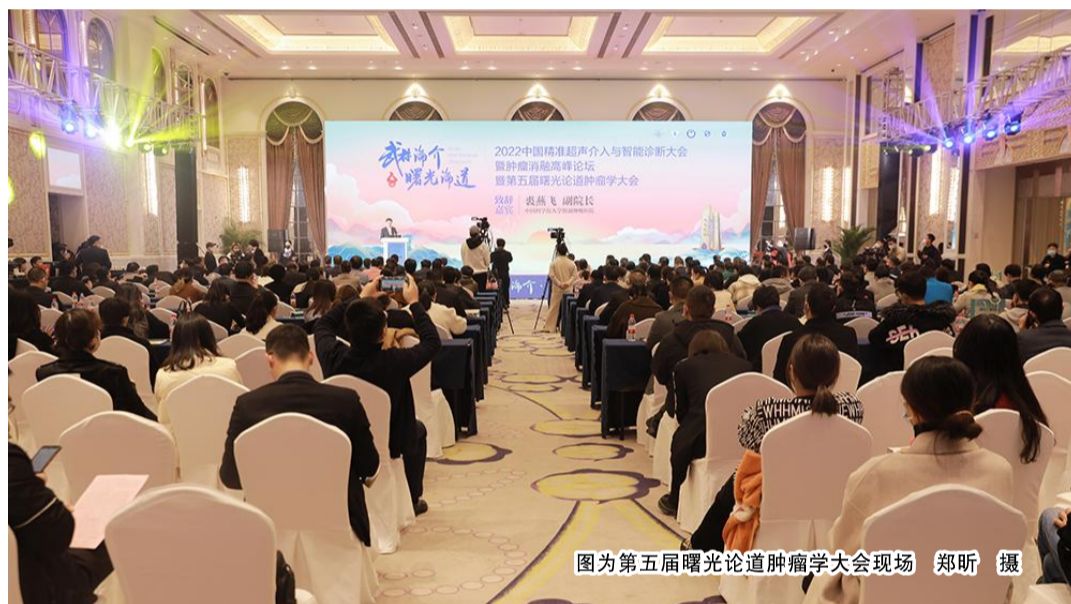
图为第五届曙光论道肿瘤学大会现场

主会场上, 重磅嘉宾齐上阵, 带来别开生面的学术盛宴。国科大肿瘤医院院长谭蔚泓院士、解放军总医院介入超声科主任梁萍教授、中山大学肿瘤防治中心微创介入治疗科主任范田君教授、中国肿瘤医院自动化院田捷教授、中国科学院黄荷凤院士、上海交通大学附属第六人民医院胡兵教授等专家学者专题授课。